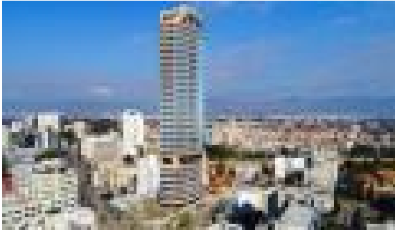
Πότε θα είναι έτοιμο το 360...