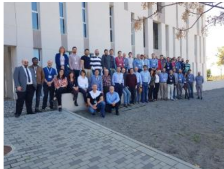
Participantes del cuarto encuentro del proyecto 5 Génesis. L.O.

5 Génesis es uno de los tres grandes proyectos financiados por la Comisión Europea para crear plataformas de experimentación con tecnología 5G. Su objetivo principal es usar esas plataformas para validar el cumplimiento de los requisitos fijados para las redes 5G en términos de velocidad de acceso o de tiempo de respuesta de los servicios de cara a los usuarios, entre otros.